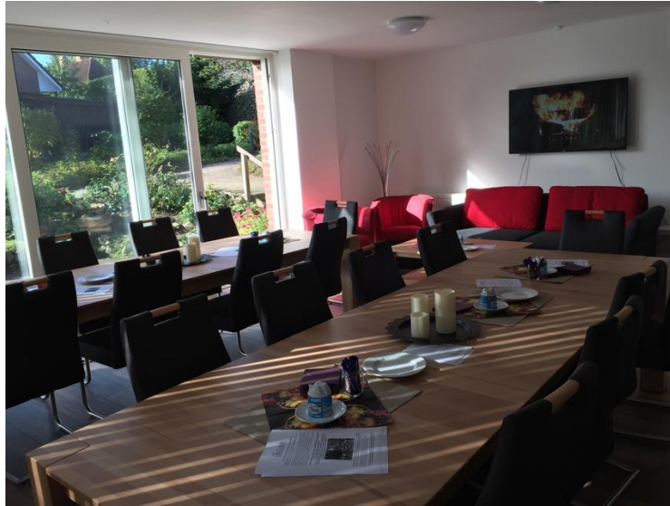
Raum der Begegnung